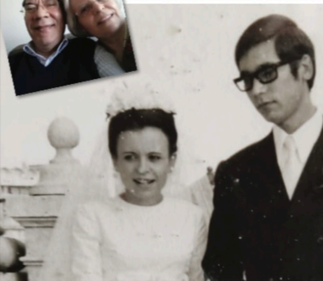
1972 - 18 de novembro - 2022